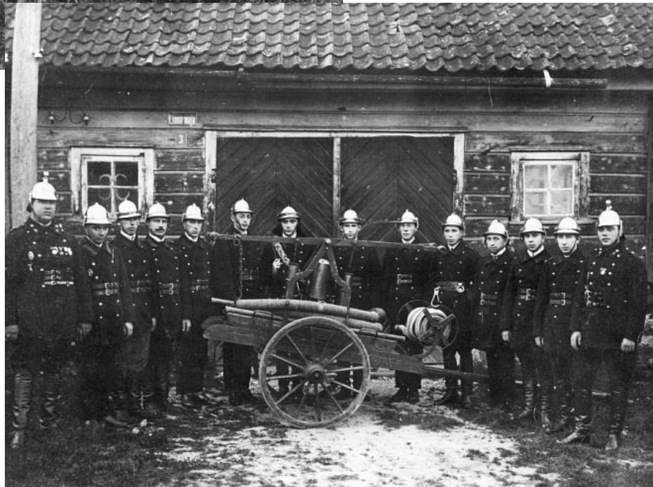
Viljandi juudituletõrje ühing 1928. aastal